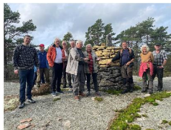
Den nyrehabiliterede stallen på Stenbudalskollen. Grenserøsa på Stenbudalskollen.

Ellers inviterer vi medlemmene til kULTURvandring i foreningens regi: