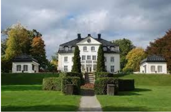
Lunsj på Baldersnäs Herrgård

Lørdag 10. juni: Planlagt utflukt i Grenseland , nærmere bestemt med buss til Dalsland: Baldersnes/Hoverud/Upperud, Dalsland hembygdsforening, Mellerud. Et samarbeid med Økomuseum Grenseland og invitasjon til BRA- og Idd og Enningdalen Historielag.